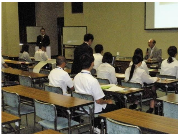
講義の様子 (金利の話、クレジットカードの話)