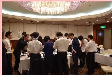
ネクタイの結び方