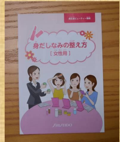
↑身だしなみの整え方(女性用)