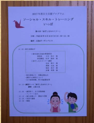
↑プログラム ＜男子編＞

資生堂ジャパン株式会社の方を講師としてお招きし、社会人としての身だしなみについて教えていただきました。