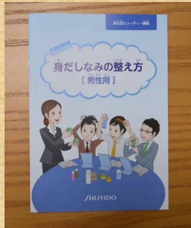
↑身だしなみの整え方冊子(男性用)