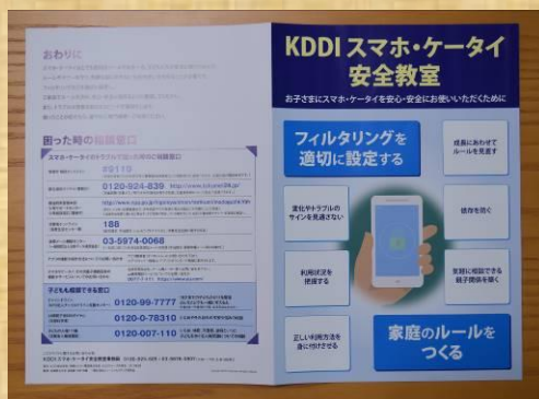
↑→スマホケータイ安全教室リーフレット